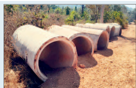
सड़क निर्माण कार्य प्रारंभ करवाने की मांग

गरियाबंद में नेशनल हाइवे 130 सी दबनई से आमामोरा ओड़ को जोड़ने वाली 31.65 किलोमीटर सड़क का निर्माण कार्य पिछले डेढ़ वर्ष से रुक गया है यह सड़क 2008 में स्वीकृत हुई थी पीएमजीएसवाई विभाग 18 साल बाद भी इस सड़क का निर्माण पूरा नहीं करा पाया है वर्तमान में 8 किलोमीटर सीसी सड़क समेत 12 किलोमीटर सड़क का निर्माण पूरा हो चुका है 10 किलोमीटर पर बीटी कार्य पूरा कर लिया गया है, जिस पर डामर डालना शेष है शेष हिस्से में काम चल रहा था, लेकिन उदंती सीतानदी टाइगर रिजर्व ने एनओसी का हवाला देकर मार्च 2025 को काम बंद करा दिया। टाइगर रिजर्व के उपनिदेशक वरुण जैन के अनुसार, निर्माण क्षेत्र का हिस्सा रिजर्व फॉरेस्ट के बफर जोन में आता है इसके लिए वाइल्डलाइफ और फॉरेस्ट एनओसी लेना अनिवार्य है। मिली जानकारी के अनुसार इस सड़क का काम 2008 में मंजूर हुआ था, लेकिन 2011 में इस क्षेत्र में नक्सली हमले में तत्कालीन एडिशनल एसपी